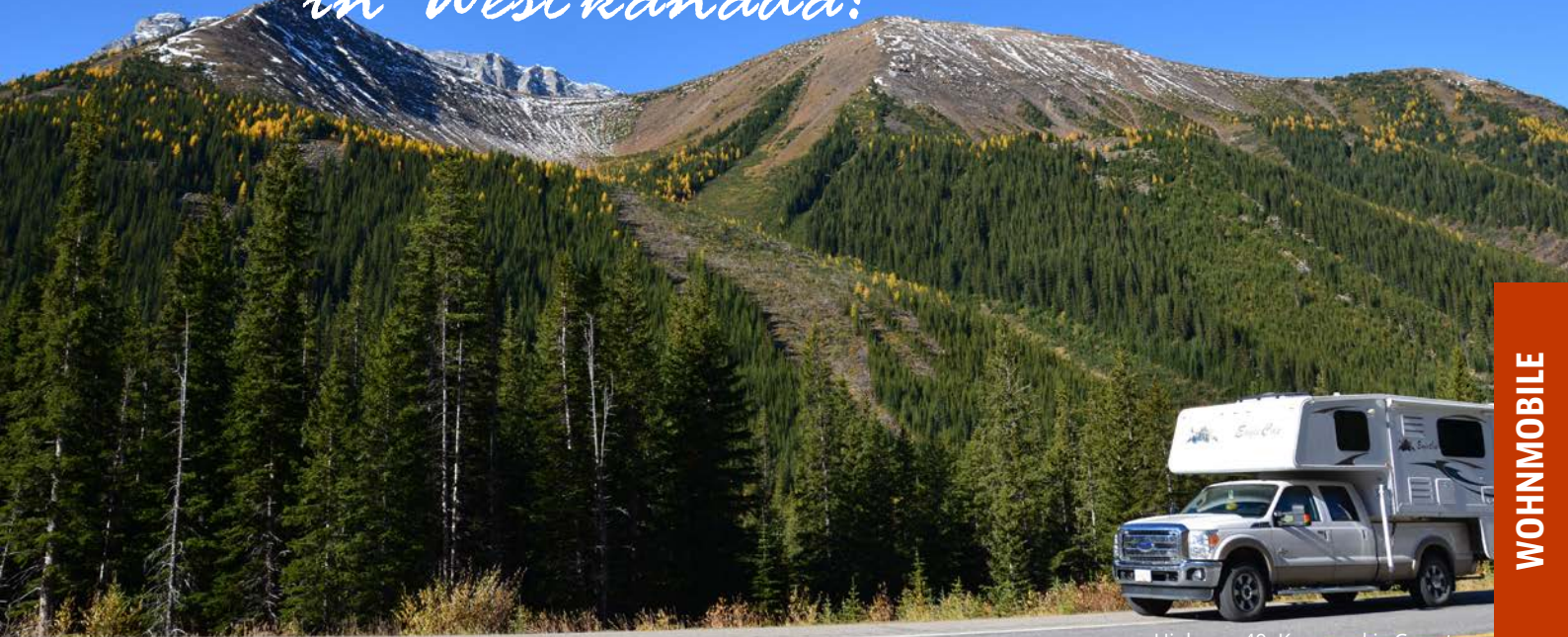
Highway 40, Kananaskis Country