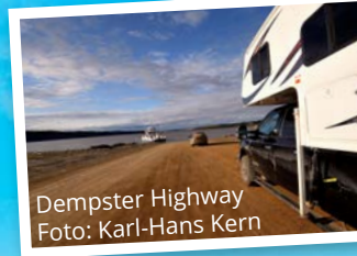
Dempster Highway