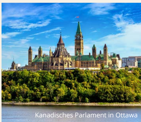
Kanadisches Parlament in Ottawa