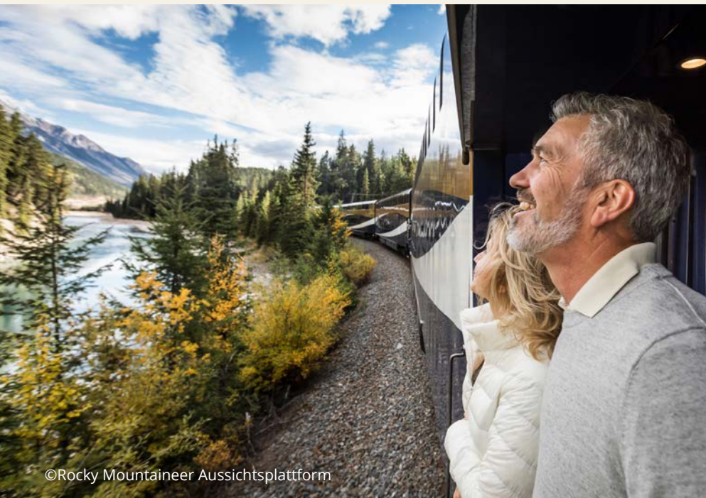
Aussichtsplattform