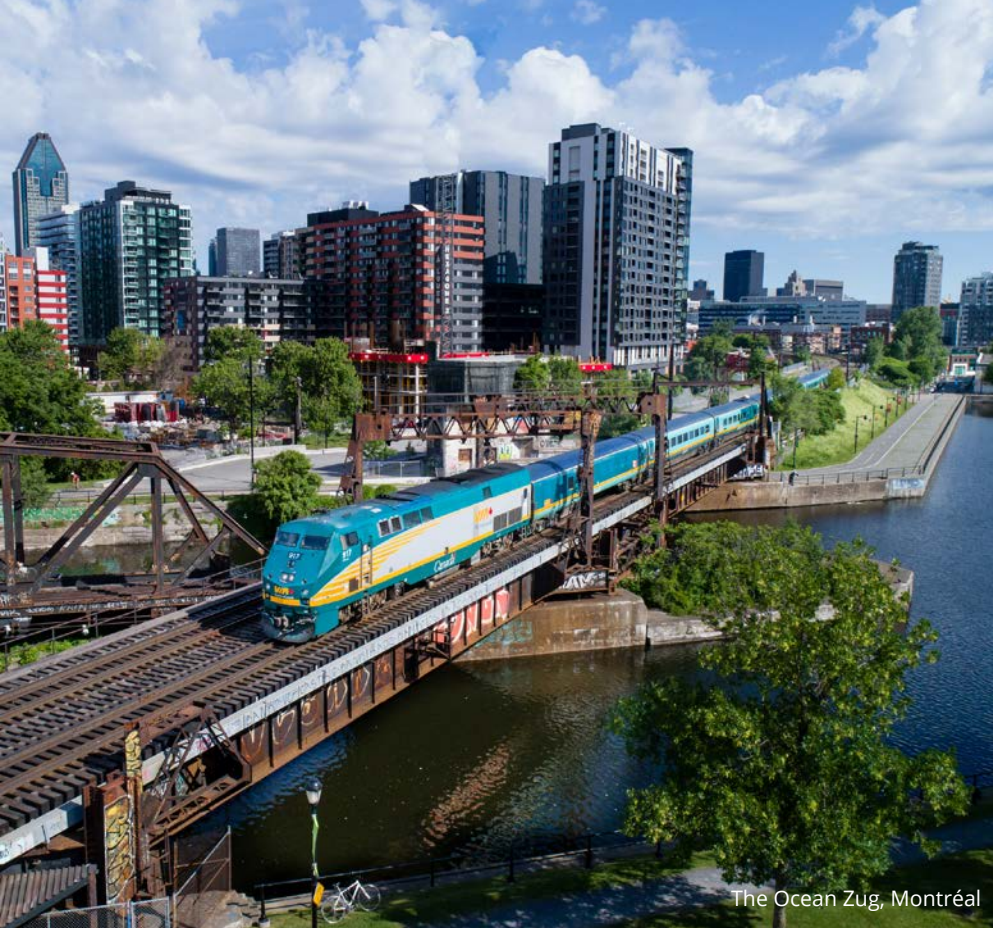
The Ocean Zug, Montréal

Naturphänomen „Tidal Bore“ bestaunen. Zweimal täglich verwandelt sich der Fluss in eine sich rasch bewegende Welle, wenn die Gezeiten der Bay of Fundy einströmen. Es ist ein beeindruckendes Schauspiel für Naturfreunde.